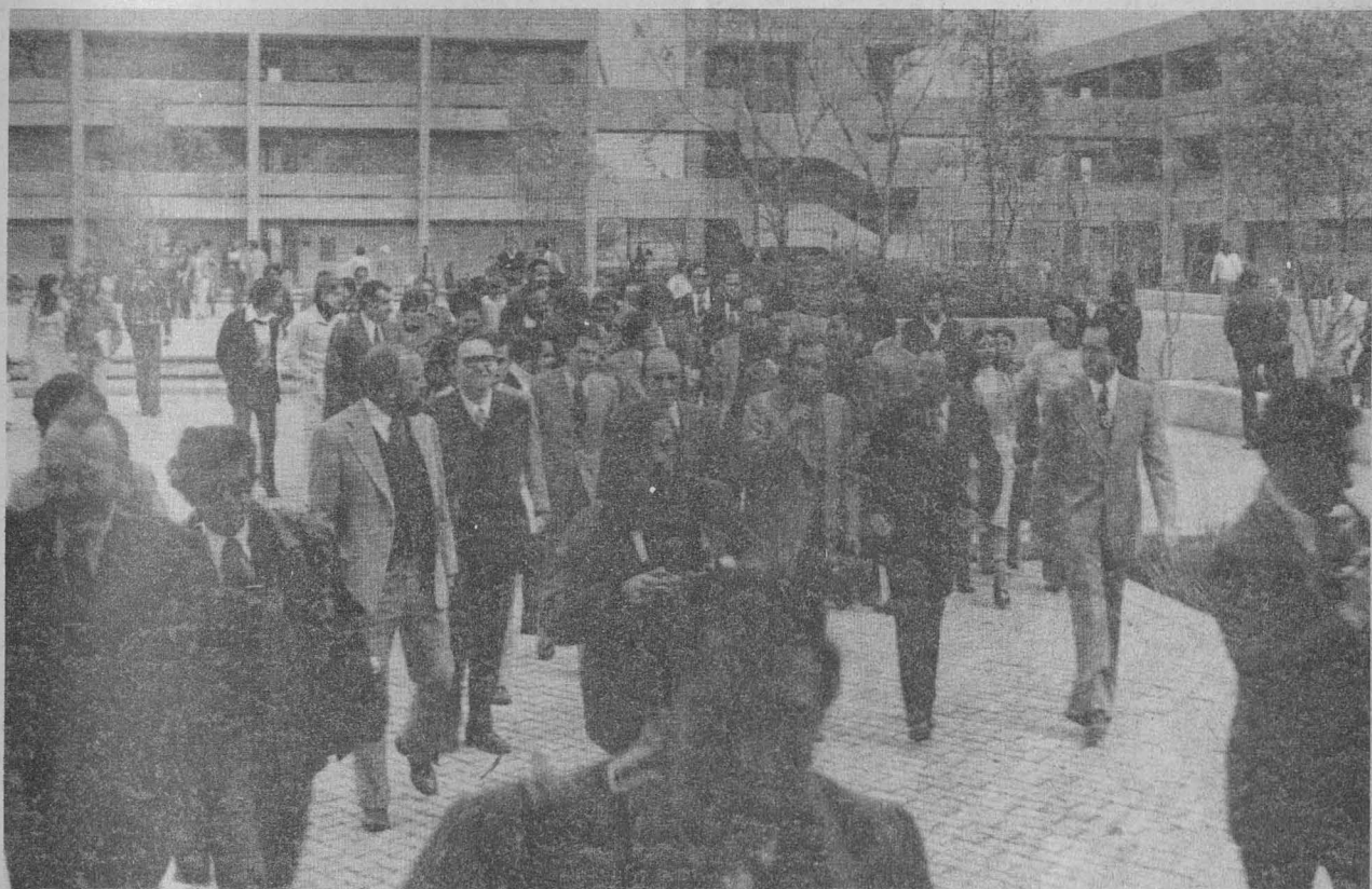
Esta fotografía fue tomada momentos después de que se inauguró el plantel de la Escuela Nacional de Estudios Profesionales de Zaragoza.

Aportarán a la UNAM posibilidades nuevas