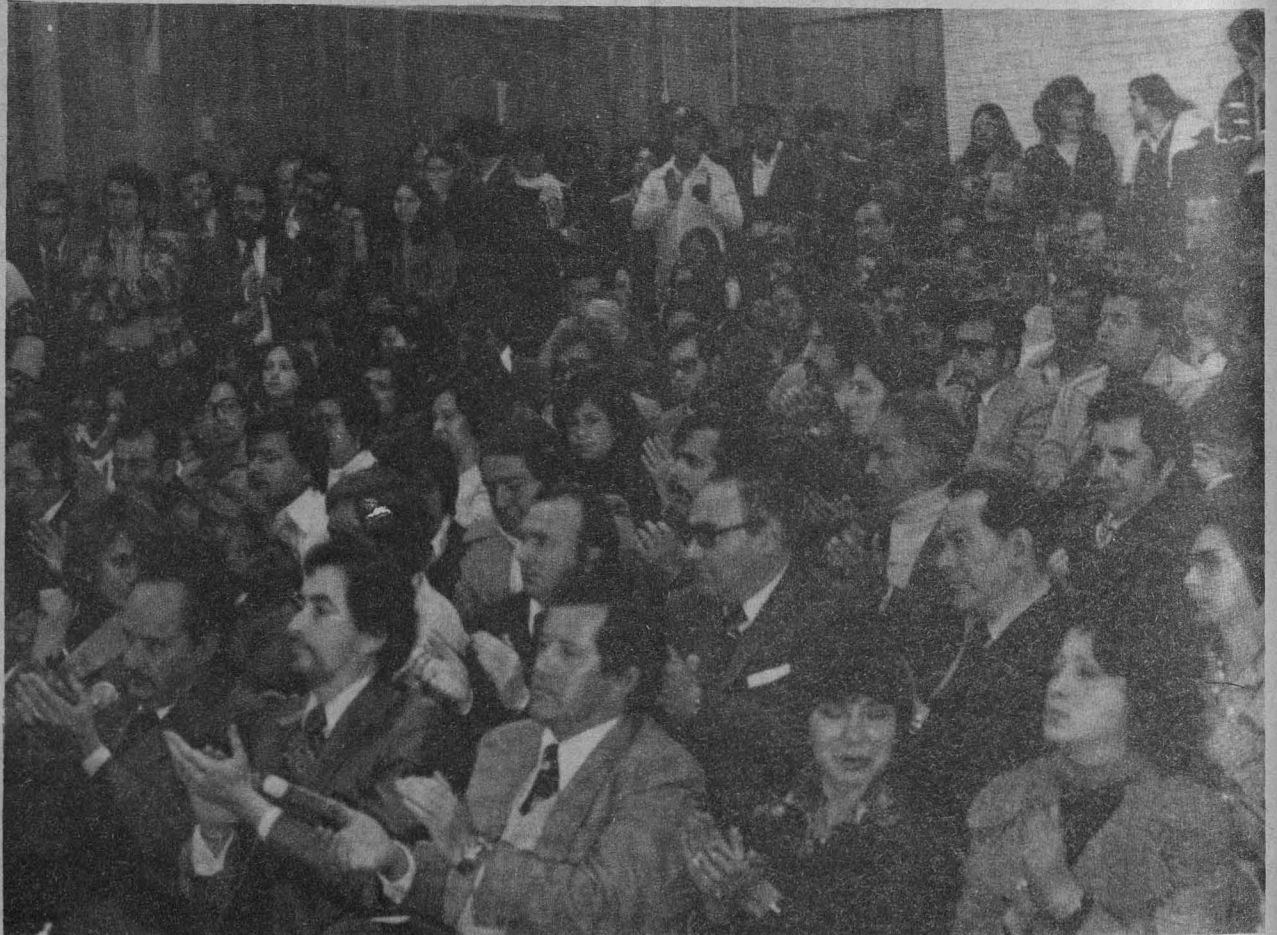
Concurrencia al acto de inauguración del plantel universitario de Zaragoza.

Después del acto celebrado en la ENEP Zaragoza, e interrogado