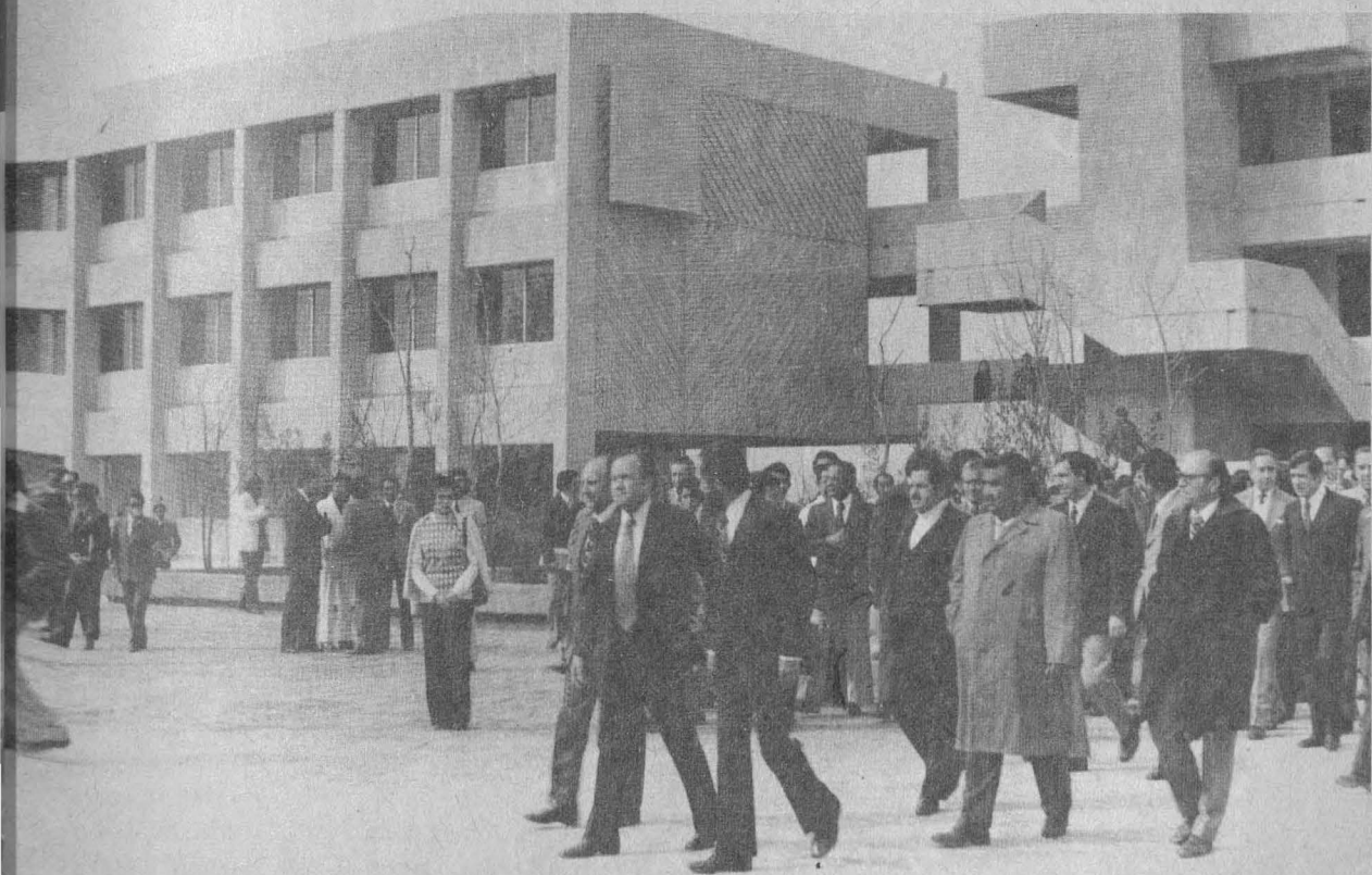
ARAGON Y ZARAGOZA, dos nuevas unidades académicas de la Universidad. Culminación del plan de descentralización universitaria en el área metropolitana. Con Acatlán, Cuautitlán e Iztacala, a la forja de los profesionales que necesita el país. Construcción de nuevas posibilidades en el ambiente de tranquilidad que impera en la Universidad.