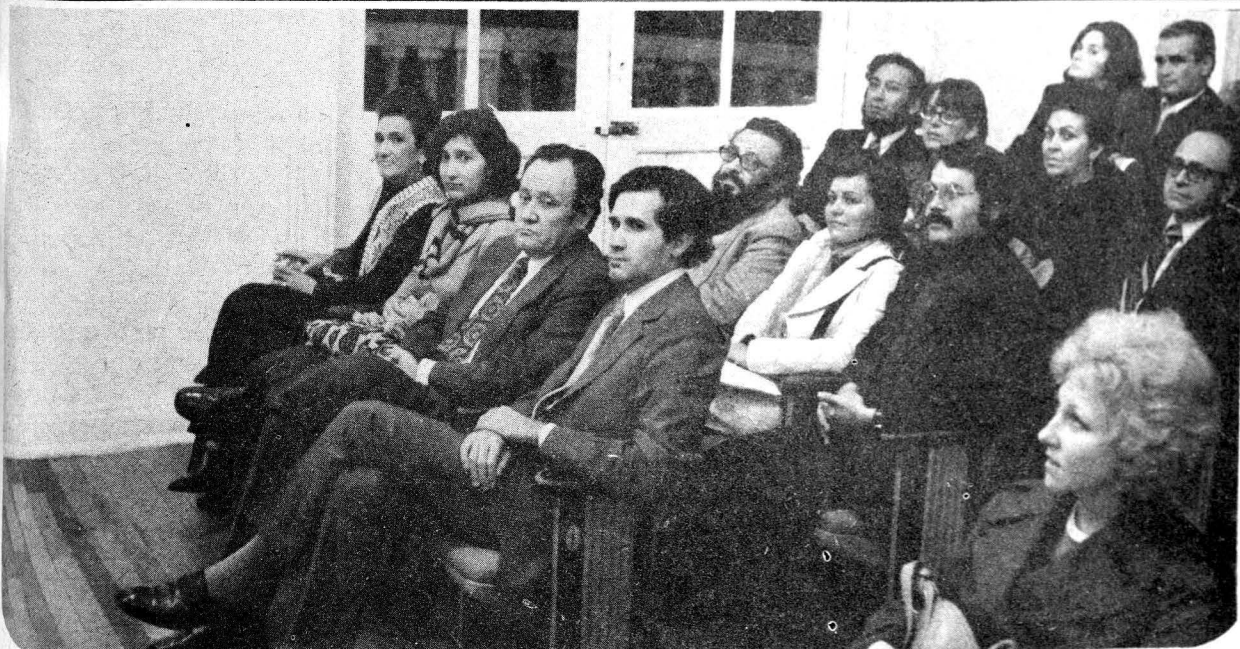
Tres momentos en el concierto ofrecido el miércoles anterior por la Orquesta Camerata de la Casa del Lago.