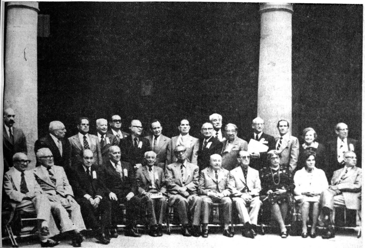
Médicos de la generación 1919-1924. El domingo 27 de los corrientes, en la mañana, se reunieron en la antigua Escuela de Medicina, en Santo Domingo. Con ellos aparecen el Rector de la UNAM y el actual Director de la Facultad de Medicina.