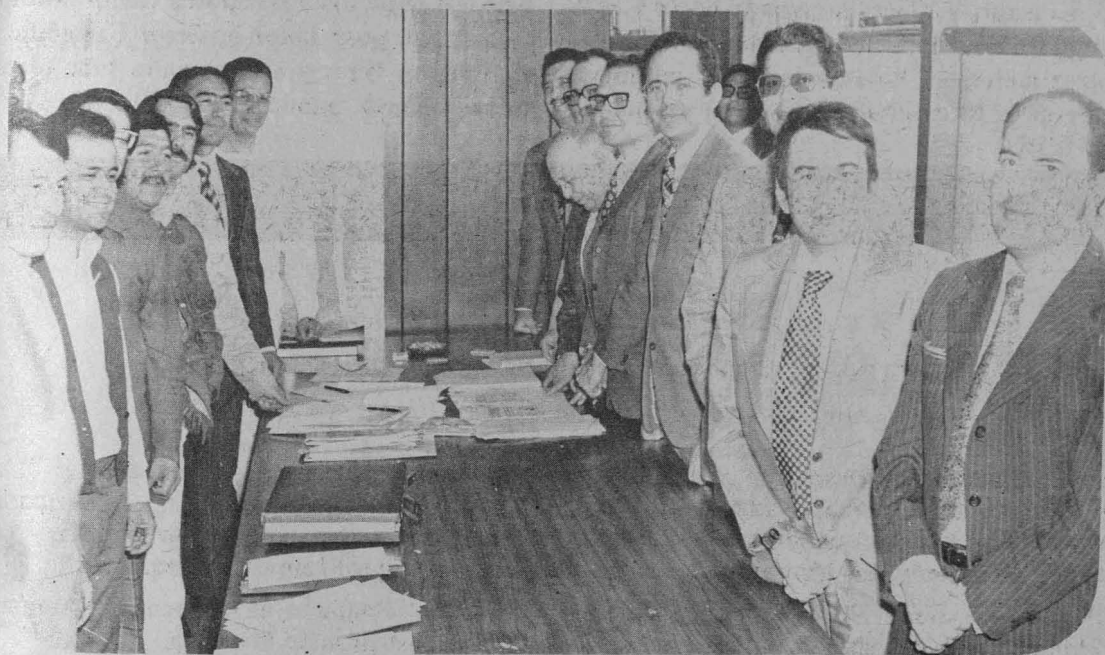
En la gráfica, la comisión designada por el Rector y los miembros de la representación sindical.