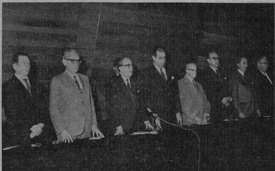
Momentos en que el doctor Ignacio Chávez, Rector de la Universidad Nacional Autónoma de México, declara inaugurado el moderno auditorio de la Facultad de Derecho. Lo acompañan en el presidium distinguidas autoridades universitarias.