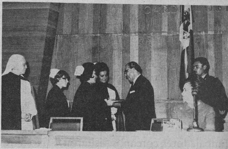
Momentos en que el doctor Ignacio Chávez, Rector de la UNAM, recibe una placa conmemorativa por ser uno de los dos principales fundadores de la Escuela de Enfermería del Instituto Nacional de Cardiología.

La ciencia del médico, no basta —prosiguió el doctor Chávez— para