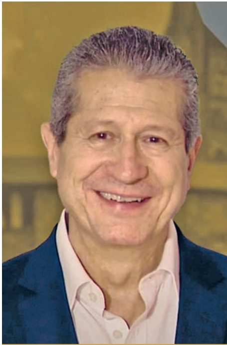
Gerardo Suárez Reynoso

Es pionero en el estudio de la tectónica de placas, especialmente de la geometría de la Placa de Cocos; gracias a sus trabajos actualmente se puede explicar la distribución del vulcanismo en el país y la brecha sísmica en la costa de Guerrero.