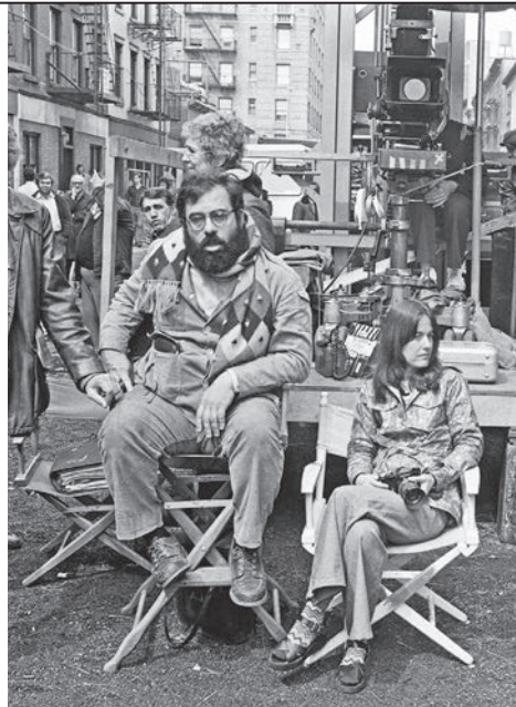
● Durante la filmación de El Padrino II .

Además, apoyó en la producción los trabajos de otros cineastas identificados dentro del llamado Nuevo Hollywood, como