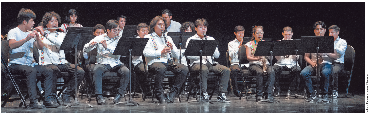
● En este encuentro debutó la Banda de músicos de becarias y becarios del Programa.