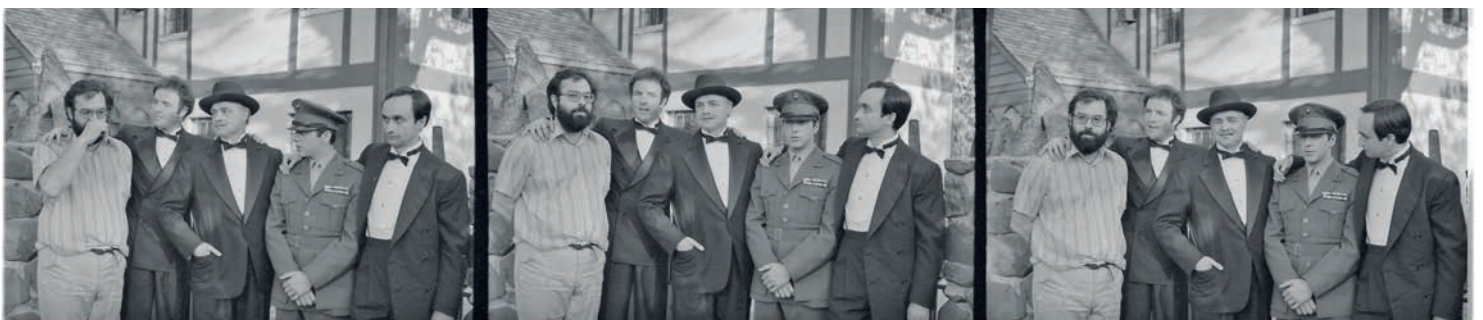
● Fotogramas con los actores durante la filmación de El Padrino .

Su última gran apuesta, no sólo personal sino económica, lleva por título Megalópolis (2024) y será presentada como parte de su homenaje en el FICM. Tras años de buscar financiamiento para el proyecto, el cineasta decidió invertir 100 millones de dólares para retratar la vida de “un arquitecto que quiere reconstruir la ciudad de Nueva York como una utopía tras un desastre devastador”, de acuerdo con su sinopsis oficial. g