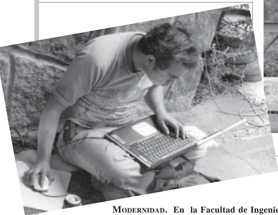
MODERNIDAD. En la Facultad de Ingeniería.