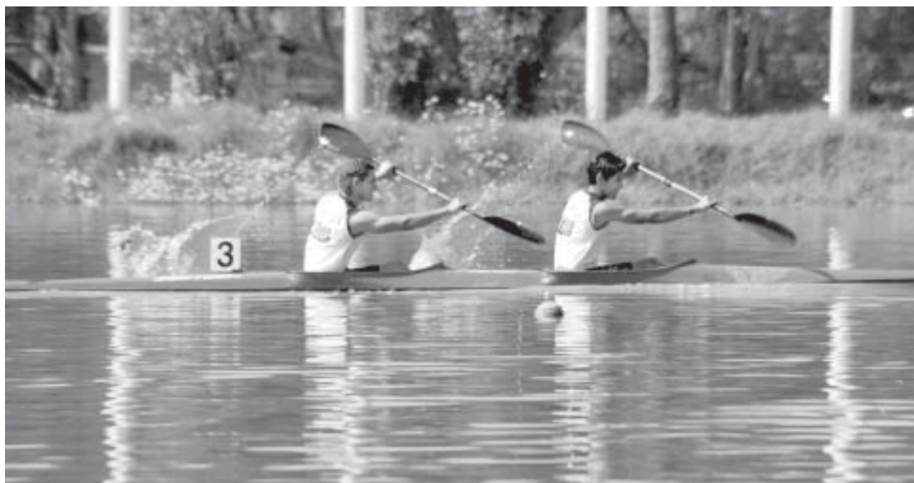
Durante la competencia.