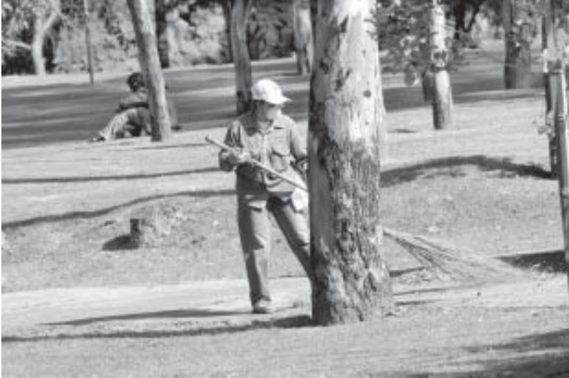
LIMPIEZA. En el camino verde.