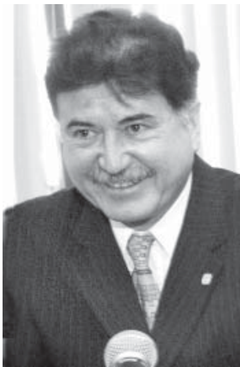
El titular del centro.

En materia de docencia, subrayó, el personal académico del centro impartió 45 asignaturas en los niveles de licenciatura, maestría y doctorado, así como en diplomados y cursos de especialización. También dirigió 12 tesis de licenciatura, 29 de maestría y cuatro de doctorado.