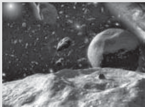
Cinturón de Kuiper.

Aún hoy, la Voyager 2 continúa proporcionando información para estudiar los confines de la influencia del Sol y el comienzo del oscuro espacio interestelar. g