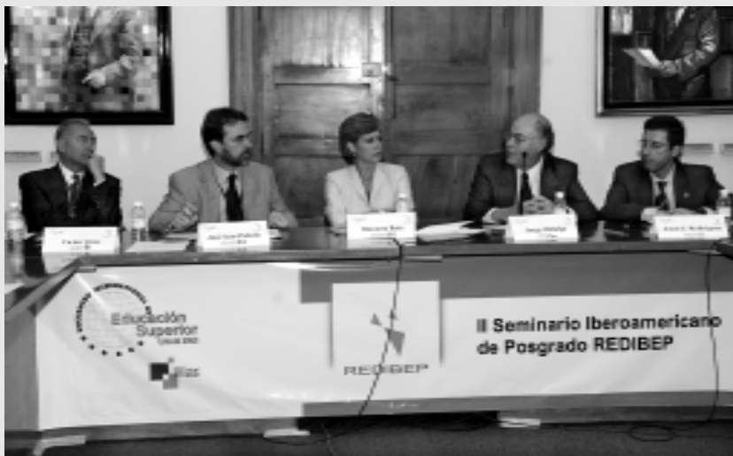
Durante el seminario sobre posgrado.

Se busca contribuir a crear espacios comunes de educación y facilitar el intercambio de alumnos y académicos