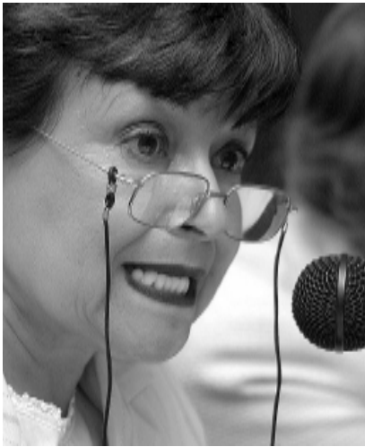
La directora, en la Torre II de Humanidades.