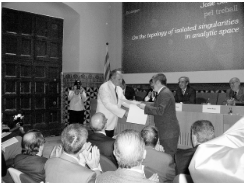
El universitario (izquierda) recibe el reconocimiento.

Para honrar la memoria de Ferran Sunyer i Balaguer la fundación otorga anualmente un premio a una monografía matemática de carácter expositivo que muestre los avances en un área actual de las matemáticas en la cual el autor haya realizado contribuciones significativas.