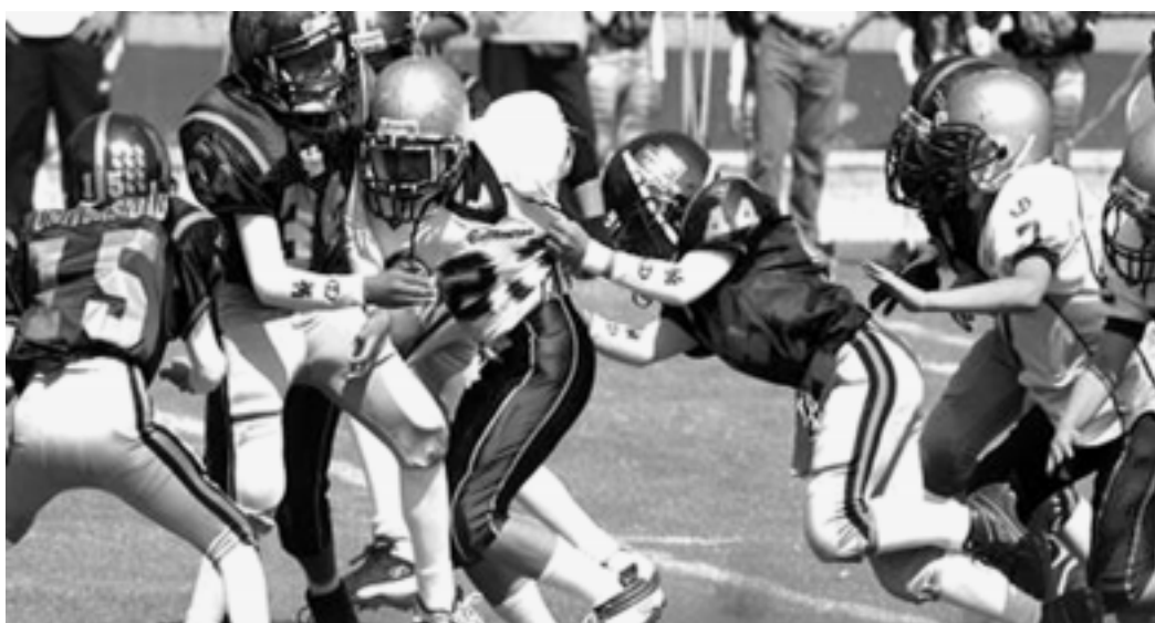
Buscan rugir en la campaña 2005.

Los cachorros pumas consiguen valiosas victorias en ambos grupos