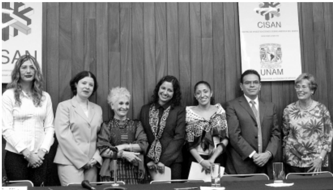
El grupo de triunfadores.