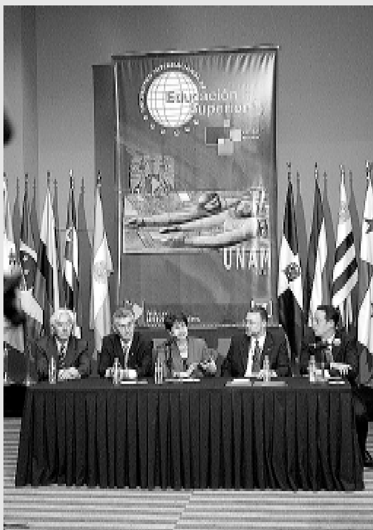
Durante la rueda de prensa, efectuada en el Palacio de Minería, en que se dieron a conocer los acuerdos de la reunión de macrouiversidades.

Un segundo aspecto se refiere a la aprobación del Programa Multimedia de Preservación y Difusión del Patrimonio Histórico, Cultural y Natural de las Macrouiversidades de América Latina y el Caribe, con más de mil imágenes en la actualidad.