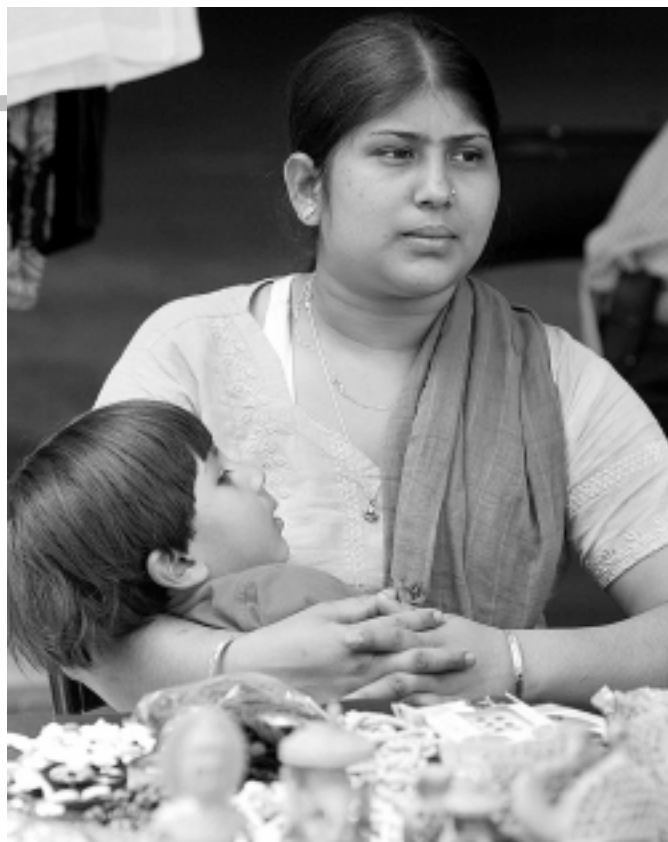
Participantes en el evento.

También hubo diversas mesas informativas. Una de ellas fue del ACNUR, que da protección y asistencia a los refugiados del mundo. Según información proporcionada, el año pasado el número de personas bajo su amparo alcanzaba poco más de 17 millones y desde su creación ha dado asistencia a más de 50 millones de refugiados, lo cual le ha merecido el reconocimiento de dos premios Nobel de la Paz: en 1954 y 1981. También otorga asistencia a otras categorías de despla-