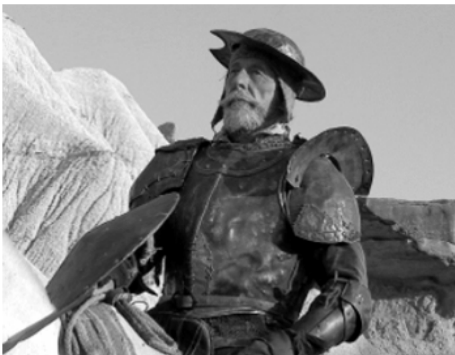
Escena de la película Lost in la Mancha .