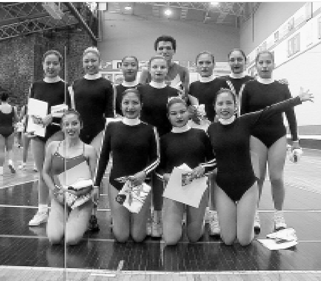
Las modalidades fueron: individual, parejas, tercias y grupal.