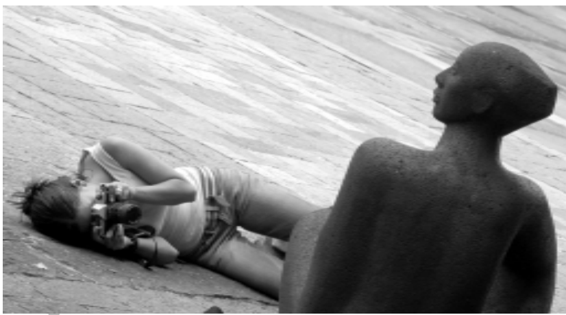
PRÁCTICAS. Fotógrafa en ciernes.