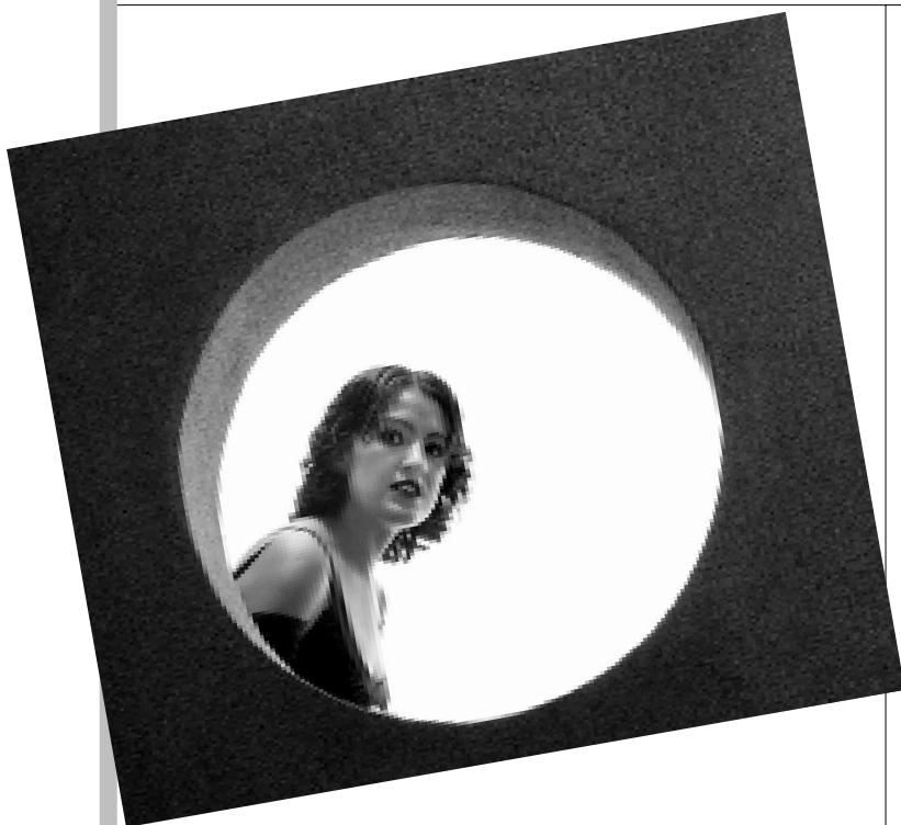
ENCUADRE NATURAL. En posgrado de Contaduría.