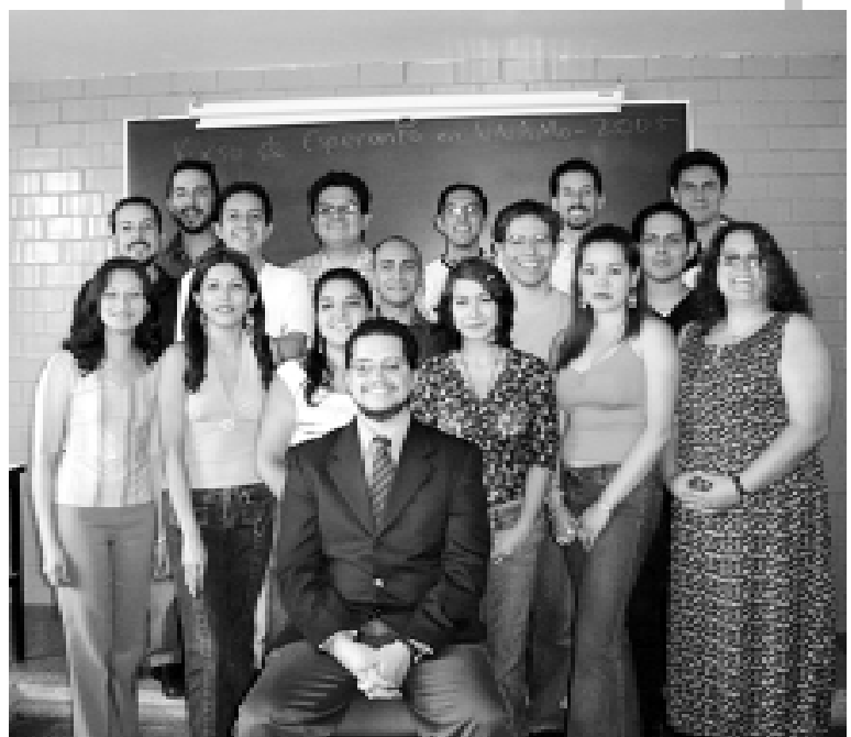
ESPERANTO. Fin de cursos en la Facultad de Derecho.