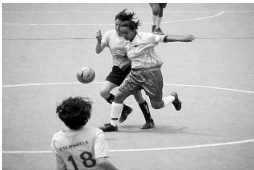
Las contadoras sumaron siete victorias.

defensa Daniela Paulín (cuyo puesto regular es el de portera). Luego volvería a anotar Sandra en jugada de shoot out . El tercero también fue de Alma Gabriela, conocida como La Doña .