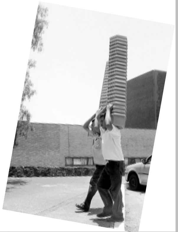
EQUILIBRIO. En plena faena.