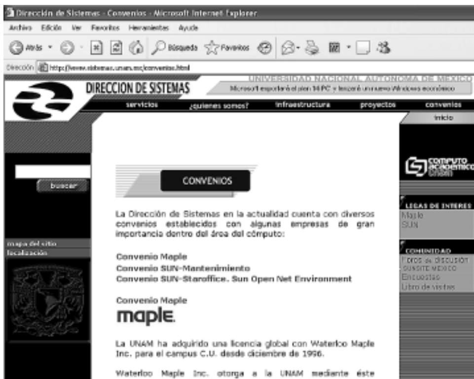
Portal de Internet.

En él se especifica que tanto la licencia de uso como todas las actualizaciones que surjan durante la colaboración se harán extensivas a todos los equipos de cómputo que utilicen o mantengan el control directo y que sean propiedad de la UNAM, que incluyen todos aquellos que la institución mantenga en operación durante cursos, congresos, ferias o exposiciones.