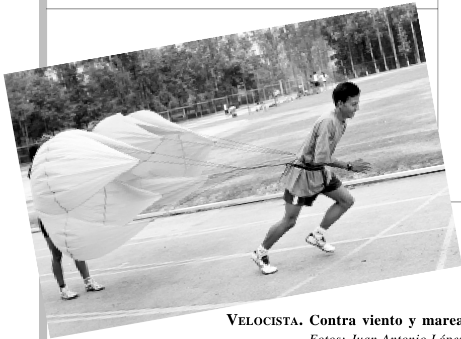
VELOCISTA. Contra viento y marea.