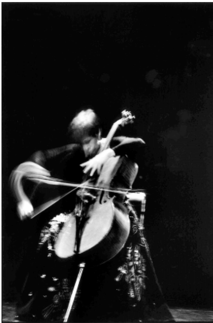
La violonchelista.