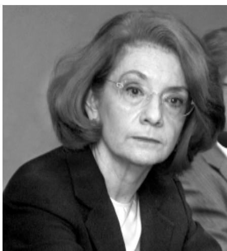
Durante el informe.

el Sistema Nacional de Investigadores, casi 85 por ciento del total y más de 20 por ciento respecto de 1997, al igual que en el PRIDE, pues pasó de casi 90 a ciento por ciento. Asimismo, 24 investigadores forman parte del Programa de Fomento a la Docencia.